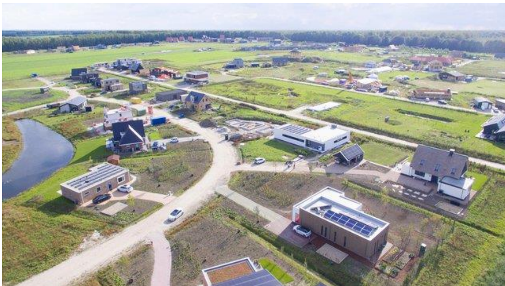
‘Luchtfoto Oosterwold Almere’ door Claire Slingerland (bron: Shutterstock )

Toch is het opvallend genoeg juist wanneer de nuance in zijn ogen ontbreekt dat De Zeeuw op z’n felst is. Zo heeft hij niks tegen de bottom up -beweging, maar wel als die manier van ontwikkelen gepresenteerd wordt als het enige alternatief. Het Almeerse experiment in Oosterwold bijvoorbeeld waar bewoners tot de straten en riolering aan toe alles zelf moesten aanleggen – en dit niet bepaald vlekkeloos verliep – kan op een vernietigende column rekenen.