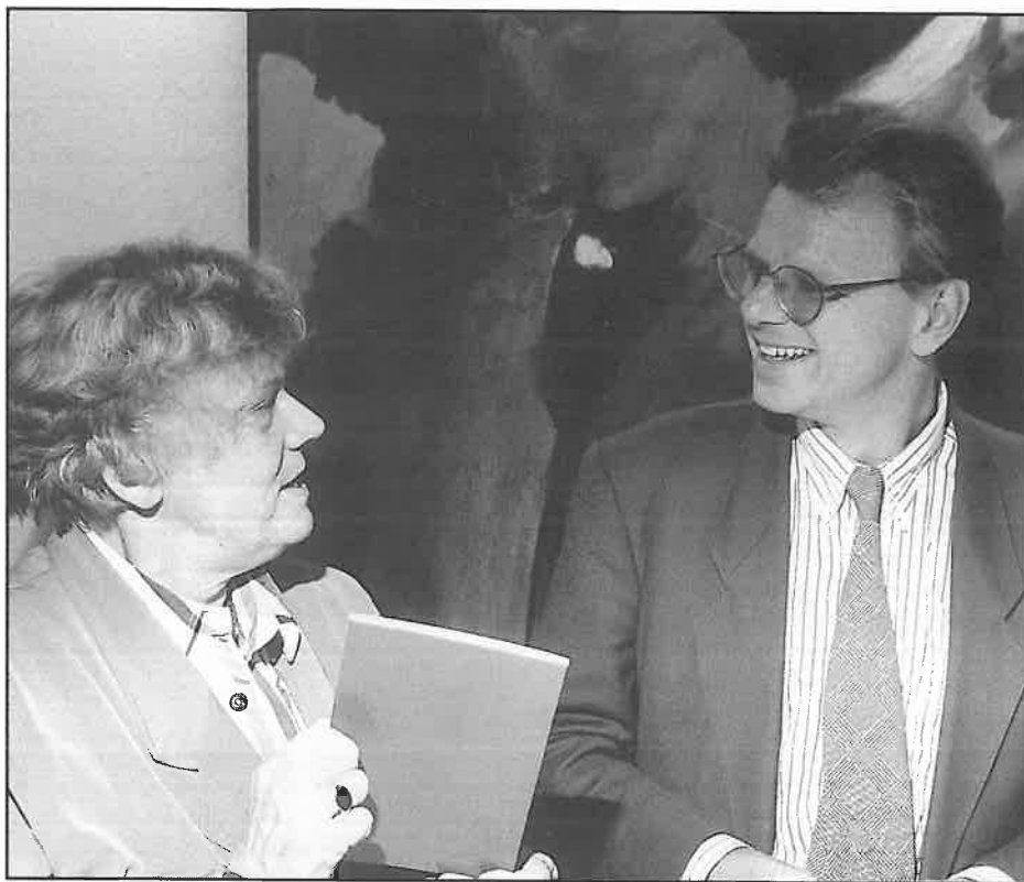
Commissievoorzitter Friso de Zeeuw overhandigt het eerste exemplaar van het rapport 'Variatie in bestuur' aan minister Dales van Binnenlandse Zaken.

– Waarom kiest de commissie eigenlijk voor deze variatie en differentiatie in het bestuur? De Zeeuw: "Omdat we op die manier